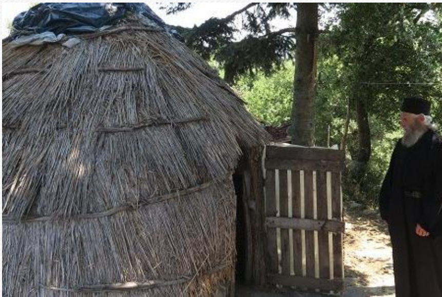
View the full image [25]