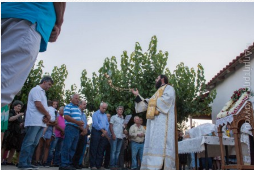
View the full image [19]