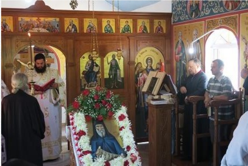
View the full image [23]