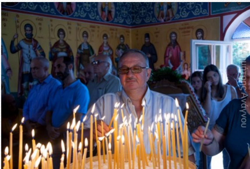
View the full image [10]