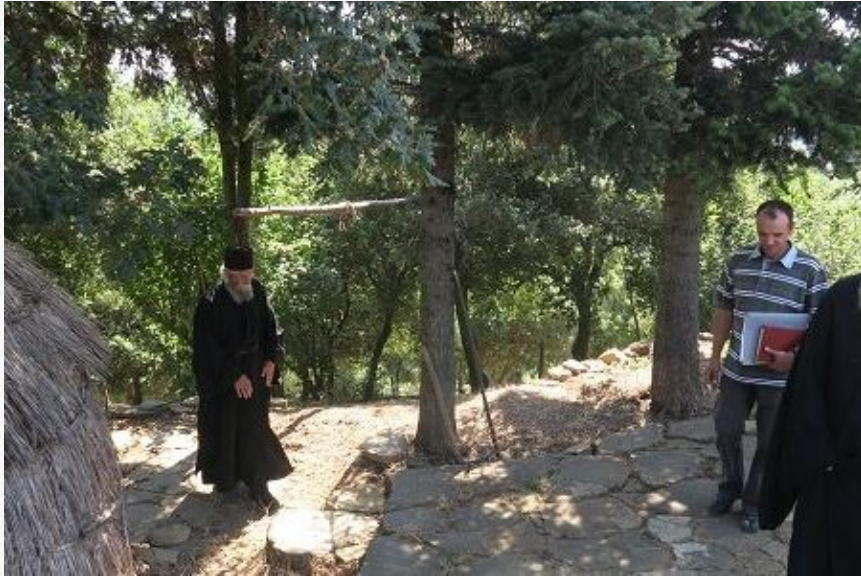
View the full image [26]