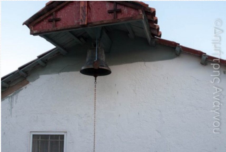
View the full image [21]