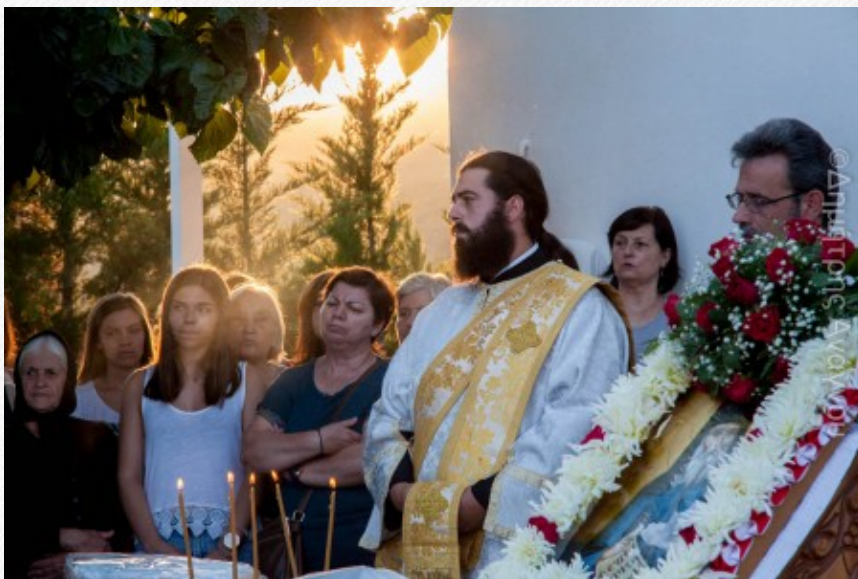
View the full image [16]