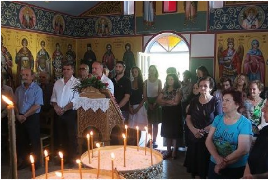
View the full image [24]