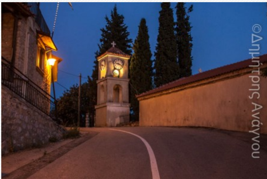
View the full image [22]