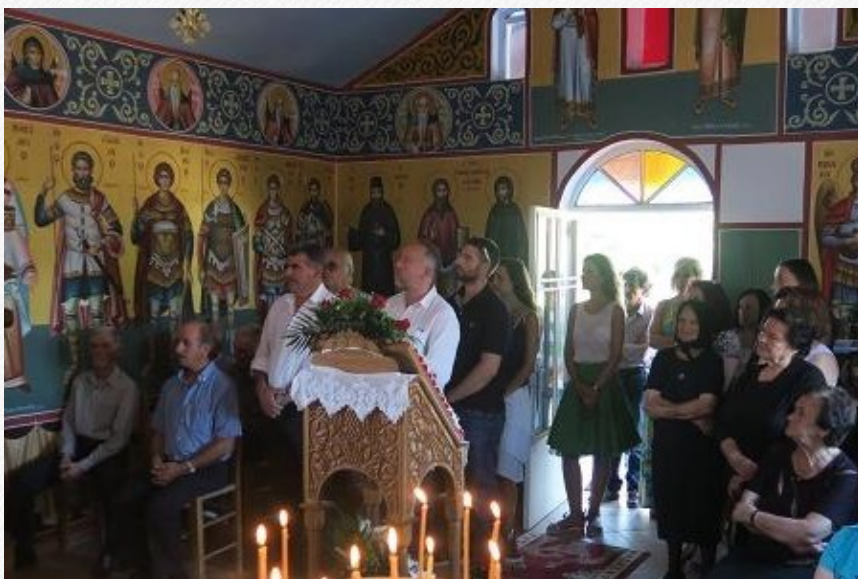
View the full image [7]