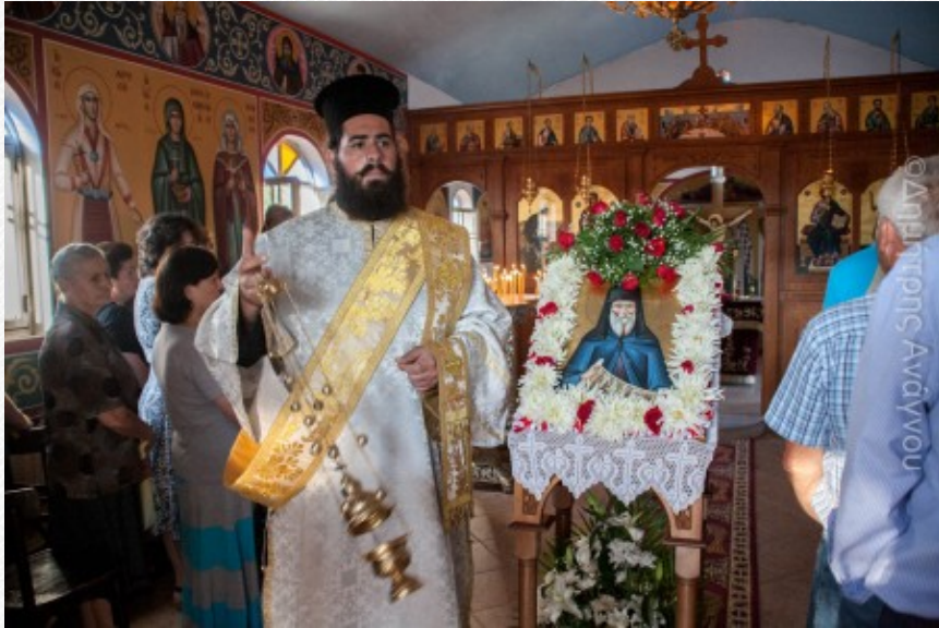
View the full image [11]