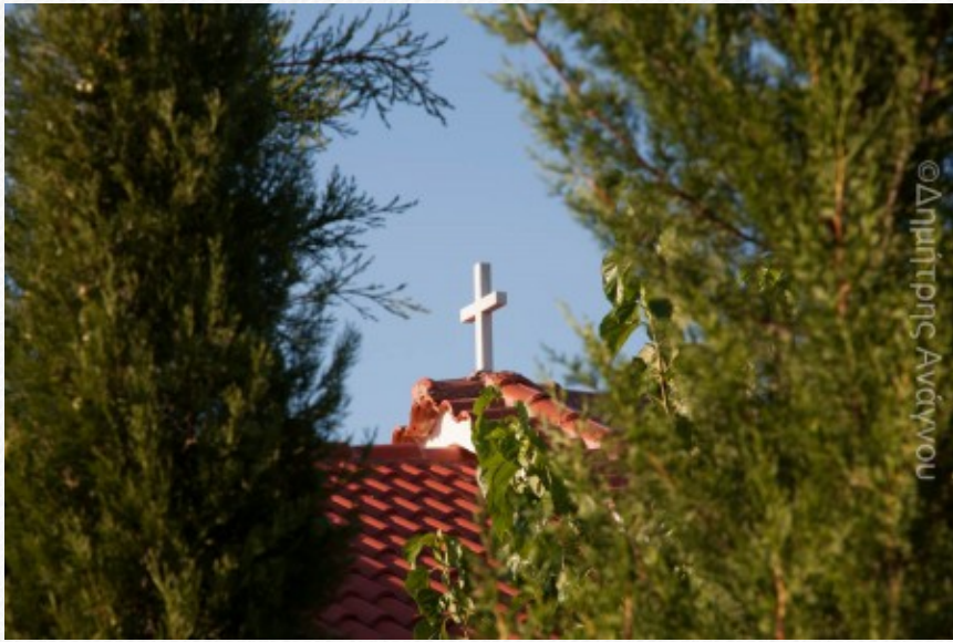
View the full image [12]