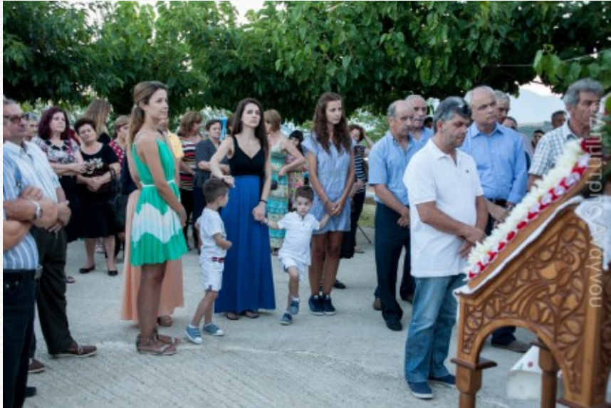
View the full image [20]