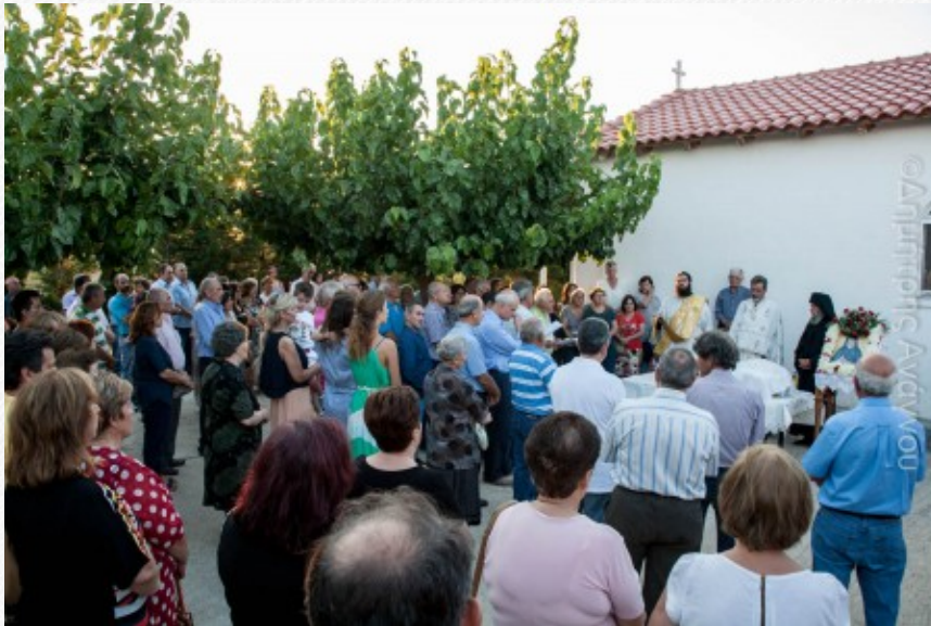
View the full image [15]