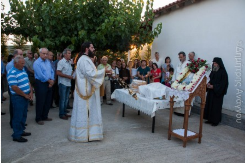
View the full image [17]