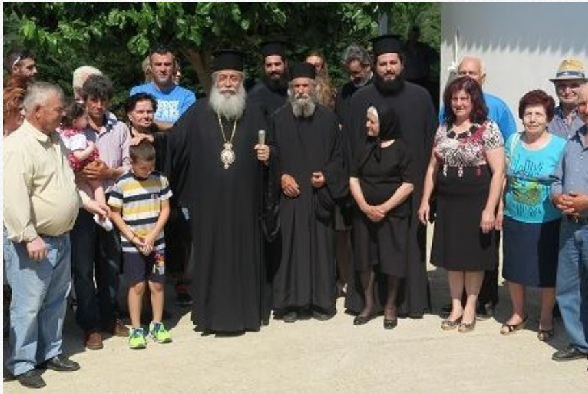
View the full image [9]