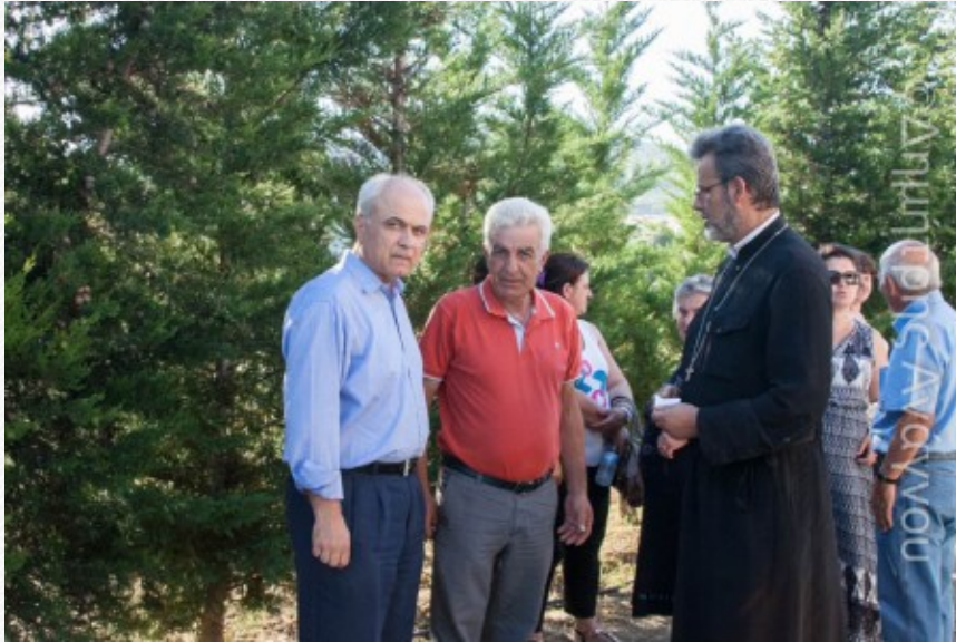
View the full image [8]