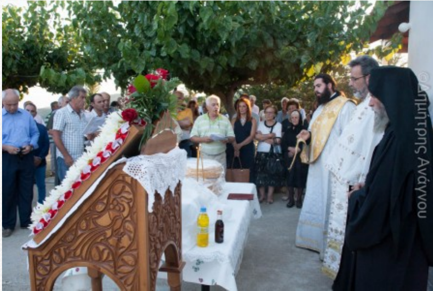
View the full image [14]