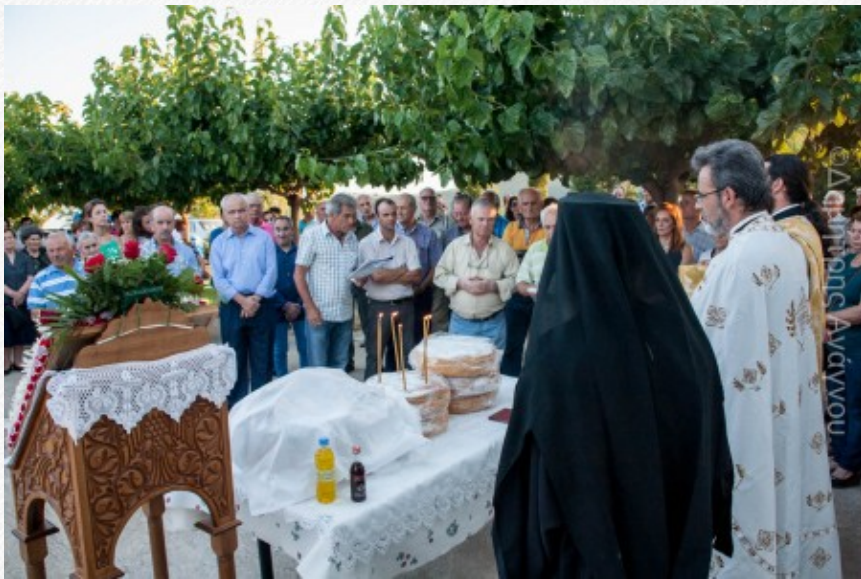
View the full image [13]