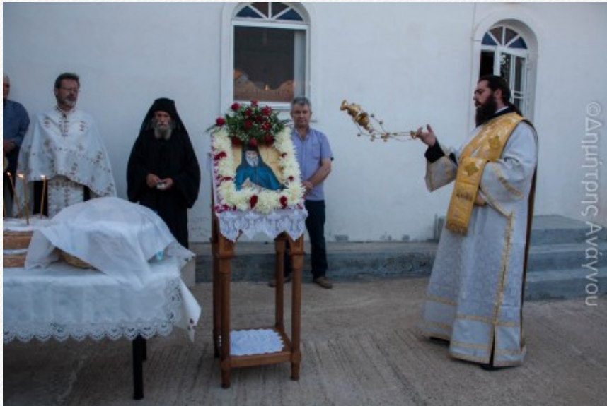
View the full image [18]