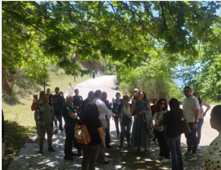
View the full image [12]