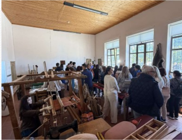
View the full image [7]