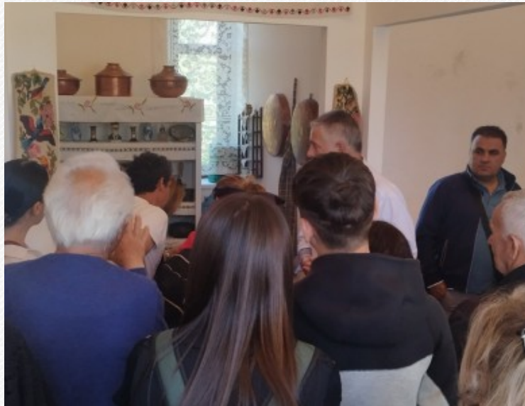
View the full image [16]