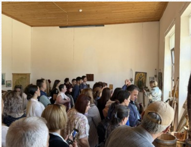
View the full image [9]