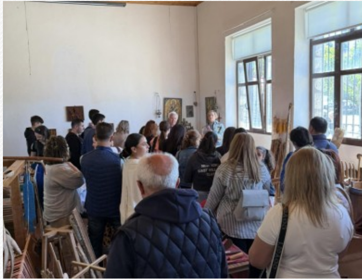
View the full image [11]