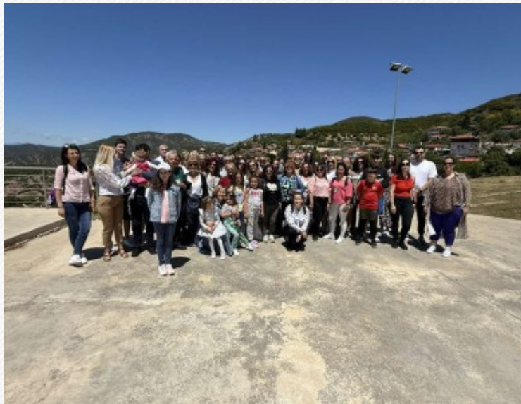
View the full image [14]