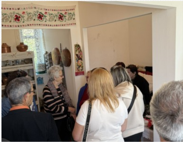
View the full image [8]