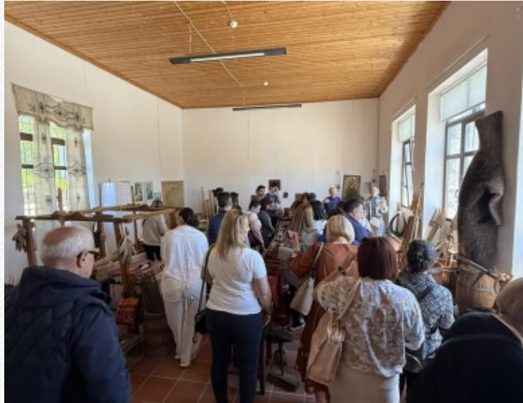
View the full image [13]