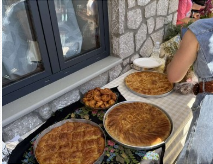
View the full image [10]