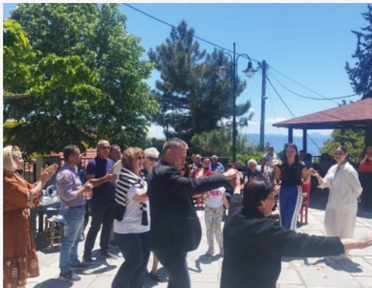
View the full image [15]