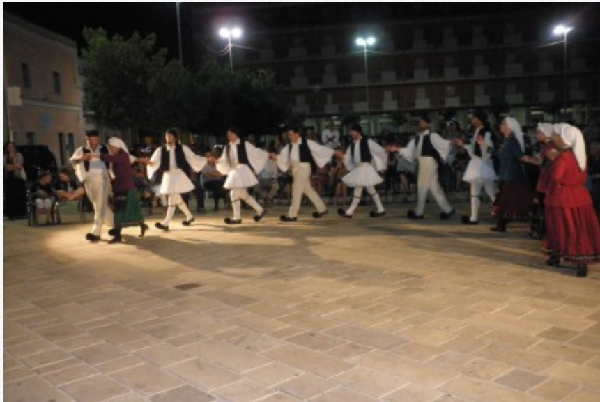
View the full image [23]