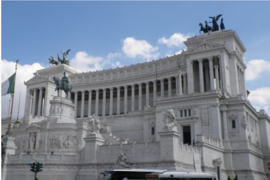
View the full image [25]