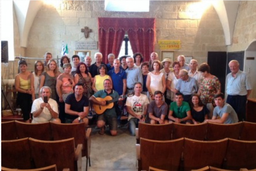
View the full image [16]