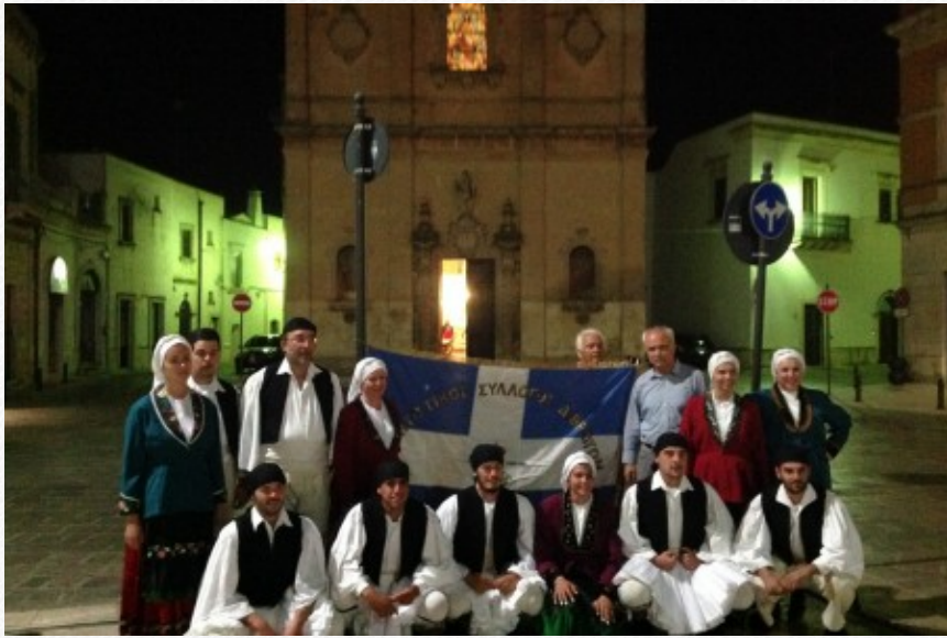
View the full image [14]