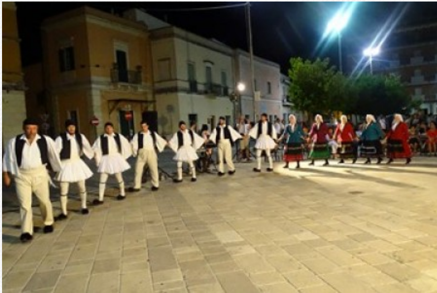
View the full image [11]