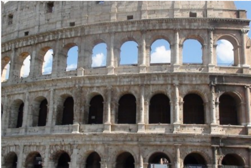
View the full image [20]