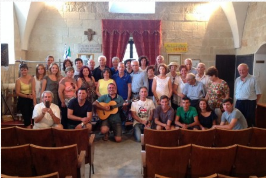
View the full image [15]