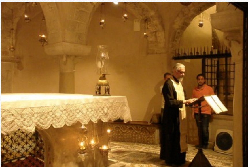
View the full image [24]