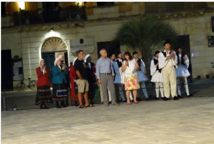
View the full image [21]