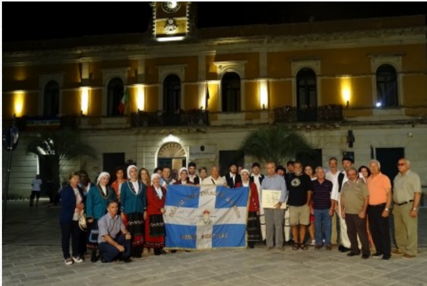
View the full image [17]