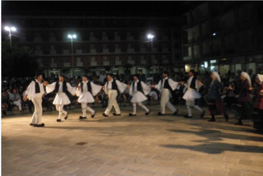
View the full image [22]