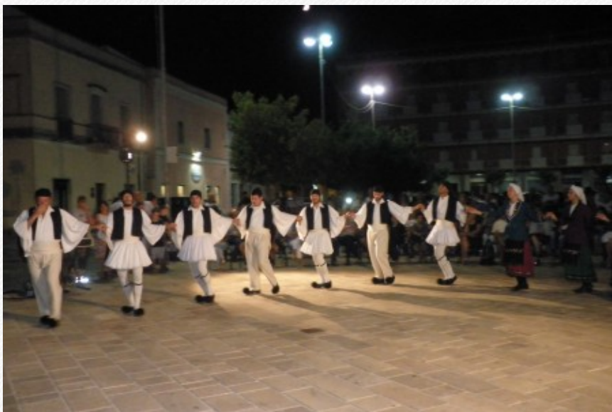
View the full image [18]