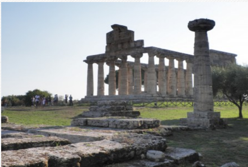
View the full image [12]