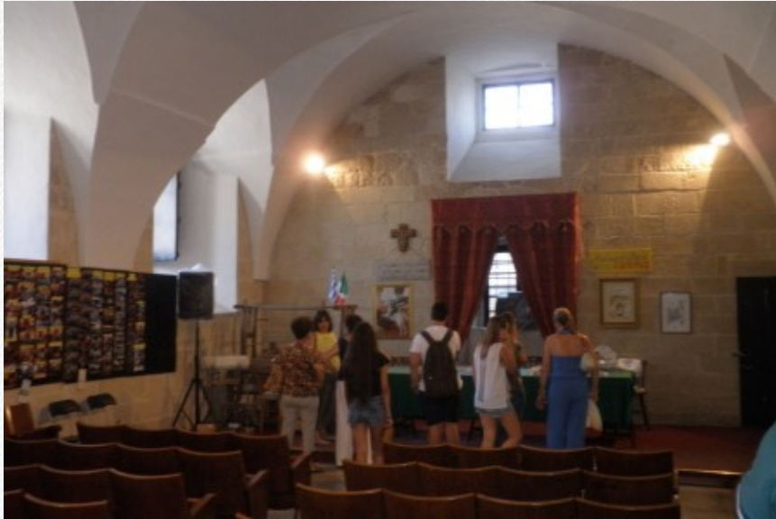
View the full image [10]