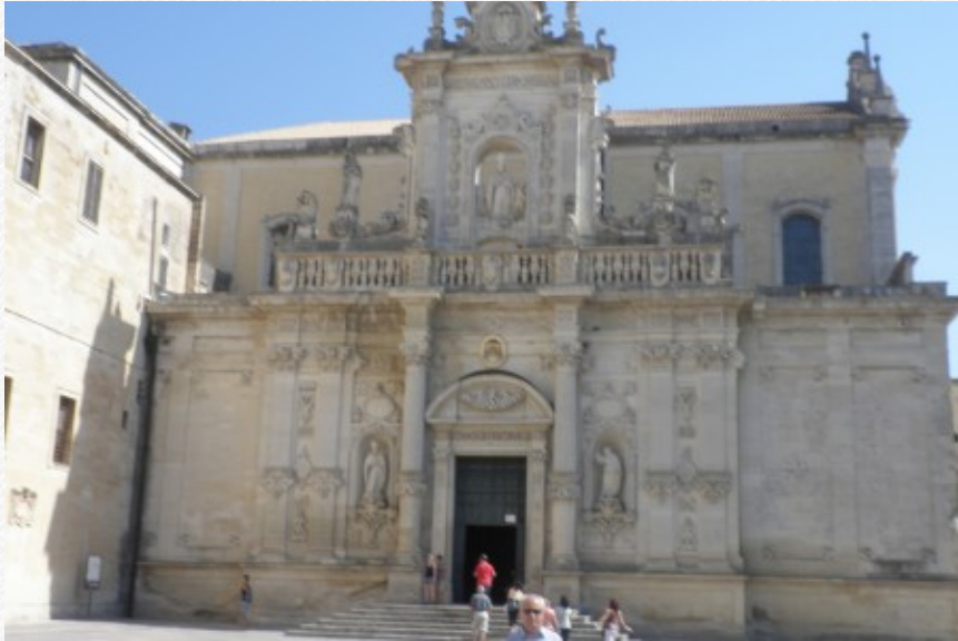
View the full image [19]