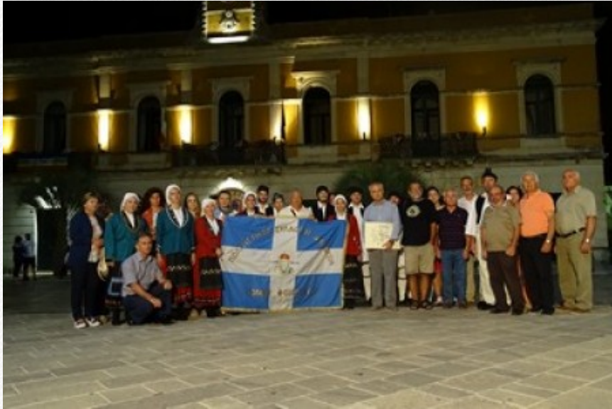
View the full image [13]