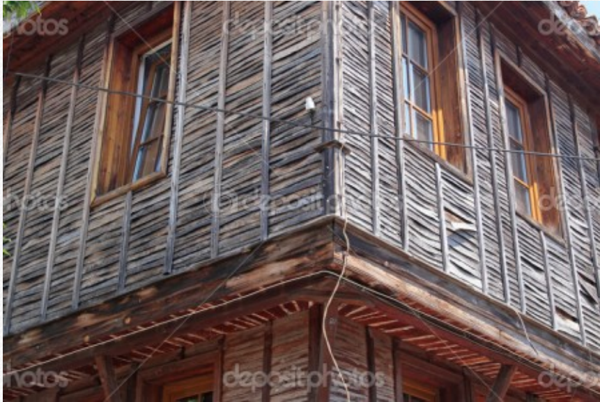
View the full image [11]