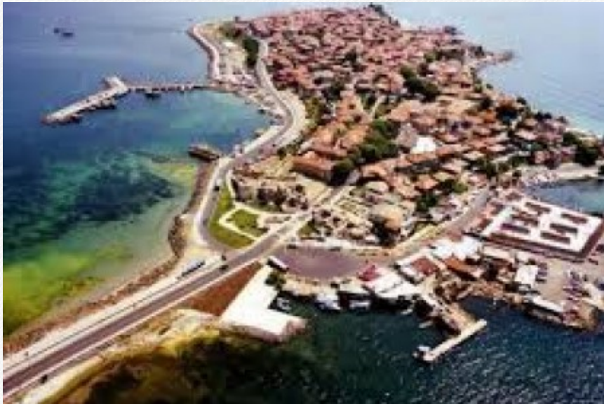
View the full image [18]