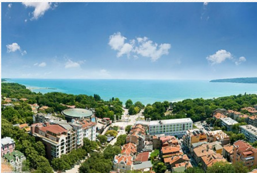
View the full image [16]