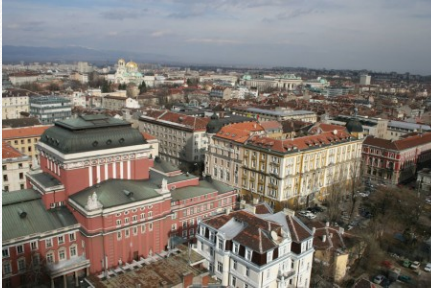
View the full image [20]