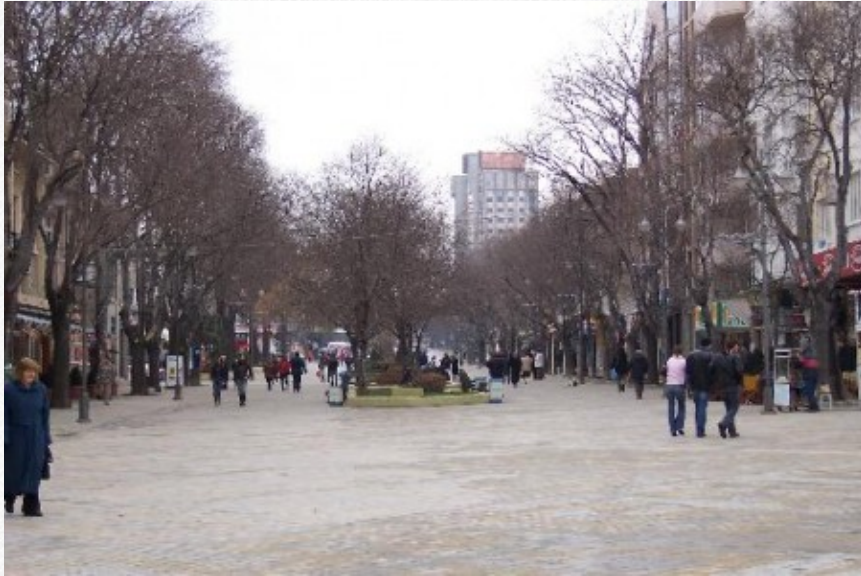
View the full image [17]