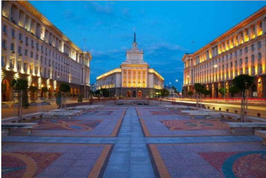
View the full image [8]