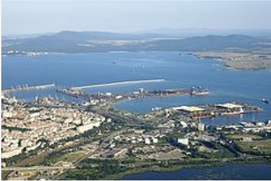
View the full image [9]