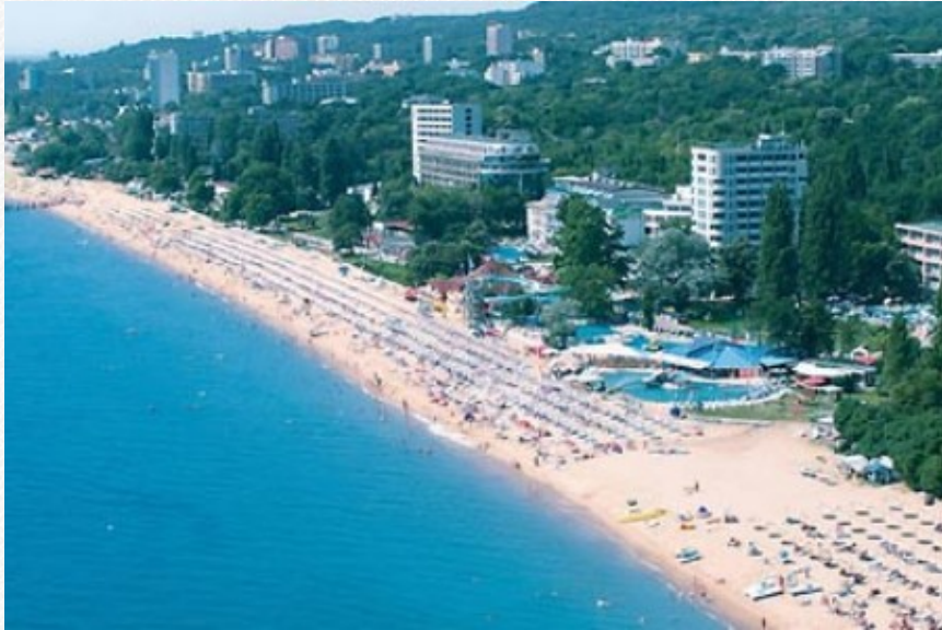
View the full image [14]