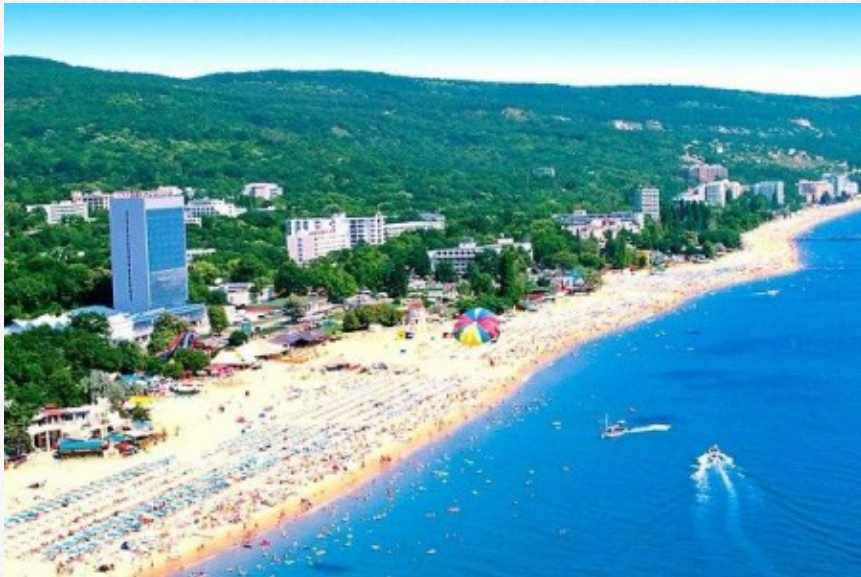
View the full image [15]