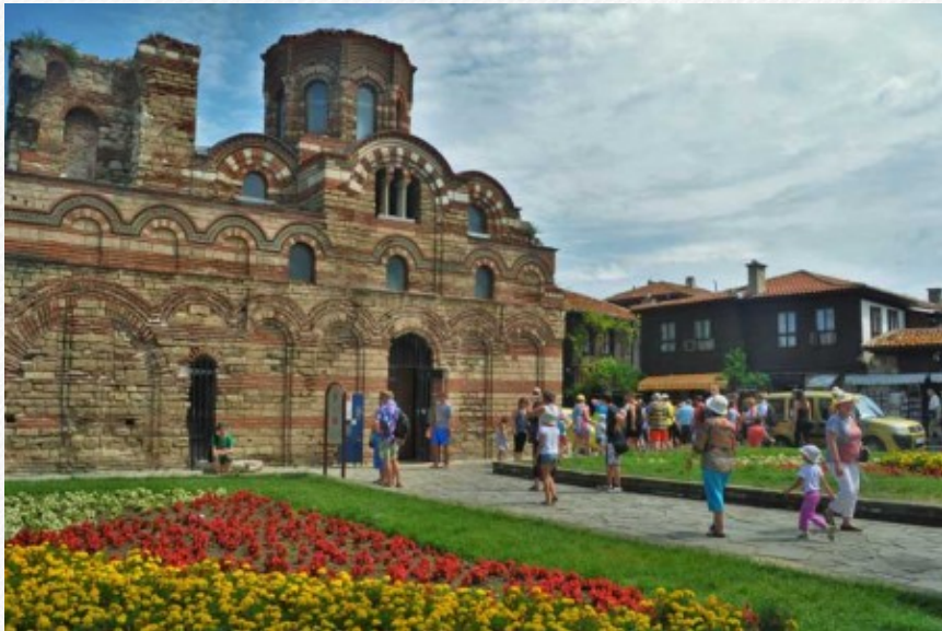
View the full image [12]