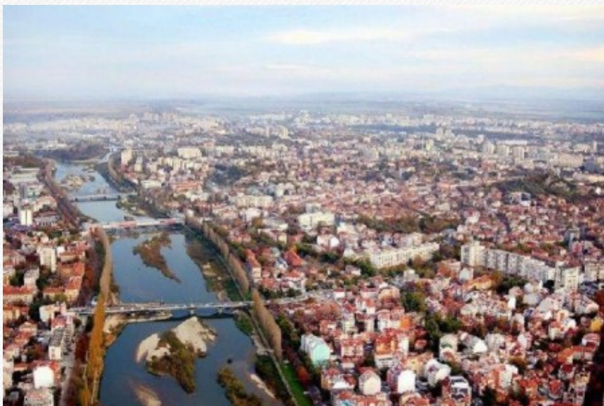
View the full image [19]