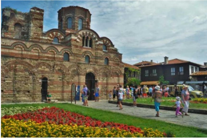
View the full image [12]