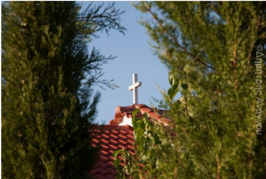
View the full image [12]